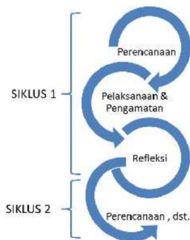
Gambar 1. Skema Siklus PTK

5 Penelitian ini merupakan Penelitian Tindakan Kelas (PTK) yang dilaksanakan dalam empat siklus. Setiap siklus terdiri dari tahap perencanaan, tahap pelaksanaan tindakan serta pengamatan, dan tahap refleksi 29 (Sugiyono, 2013). Skema tahapan tiap siklus dapat dilihat pada Gambar 1. Siklus pertama membahas tentang folium (daun), siklus kedua tentang flos (bunga), siklus ketiga tentang inflorescentia (bunga majemuk), dan siklus keempat membahas tentang fructus (buah). Setiap siklus dilaksanakan dalam dua kali perkuliahan yang setara dengan 2 x 90 menit.